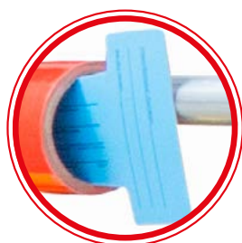
Media cards REF: PHTIEIR